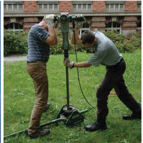
Rammkernsonde mit Pneumatischem Hammer